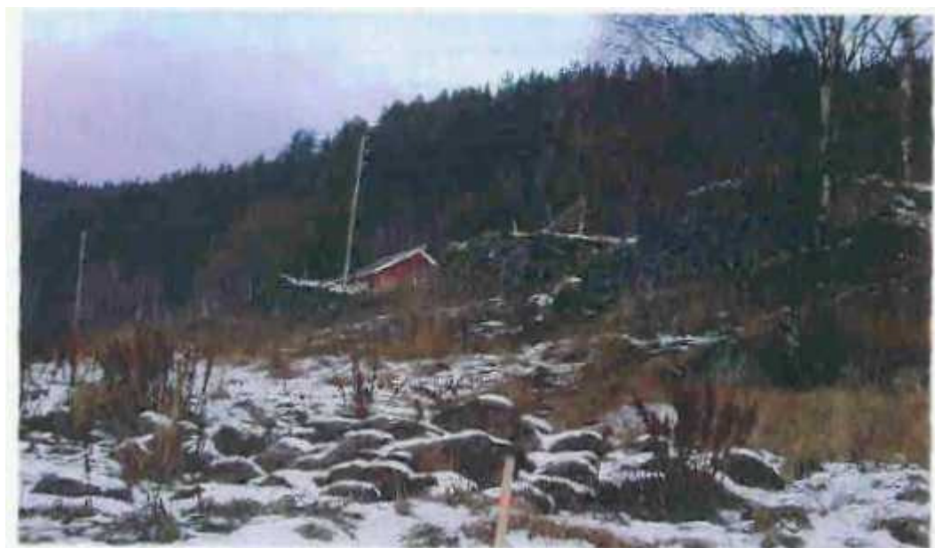
Figur 2: Oppmurt terrassekant ved kulturmark

Det er registrert kulturminner fra nyere tid i planområdet i form av oppmuringer og røyser. Planforslaget imøtekommer anbefalinger fra Oppland fylkeskommune – fagenhet for kulturverv, om å verne disse kulturminnene. Det er ikke registrert automatisk fredede kulturminner i planområdet.