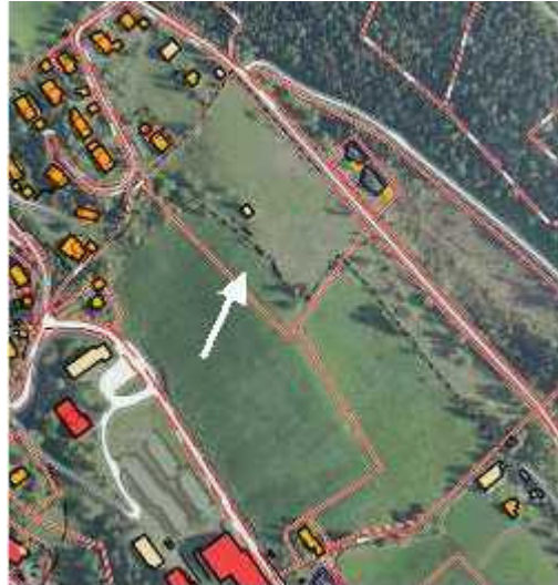
Figur 4: Området vist som LNF-område i kommunedelplanen utgjør kun 3 daa.

Rådmannen mener arealbruken av planområdet ble avklart da området ble fradelt fra eiendommen til Oppland fylkeskommune i 2002, og at det derfor er urimelig ovenfor forslagsstiller nå i ettertid å kreve at området tas ut av planen. Det er Oppland fylkeskommune som er hjemmelshaver for landbruksområdet sør for planområdet.